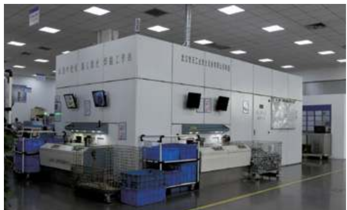
Роботизированная рабочая станция для лазерной сварки