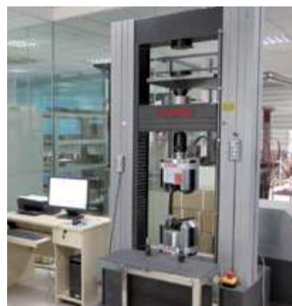
Микрокомпьютерная универсальная испытательная машина