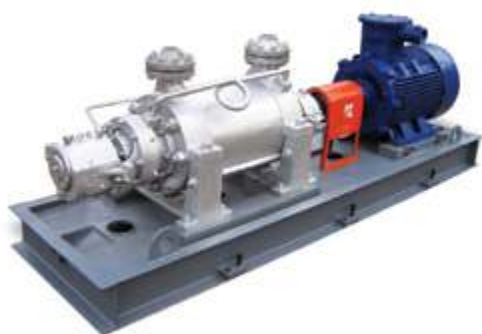
AY Многоступенчатый насос

В настоящее время концерн Kaiquan производит 9 серий и 250 разновидностей насосов, которые могут использоваться в нефтехимической промышленности. Продукция соответствует национальному стандарту GB, стандарту Американского института нефти API 610, американскому стандарту ANSI, международному стандарту ISO и др. Насос может выдерживать температуру среды от – 45 до + 450 °С, а самое высокое рабочее давление может достигать 9 МПа.