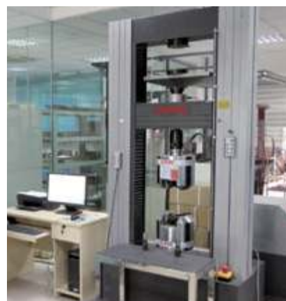
Микрокомпьютерная универсальная испытательная машина