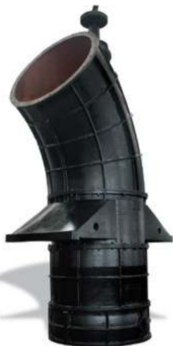
ZLHL Осевой насос