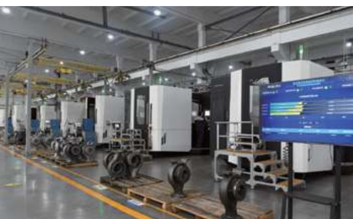
Обрабатывающий центр Демаг (Demag)