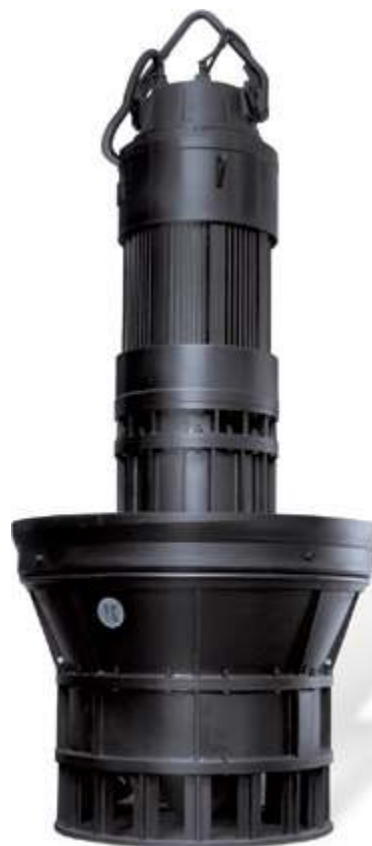
ZQ Погружной осевой насос