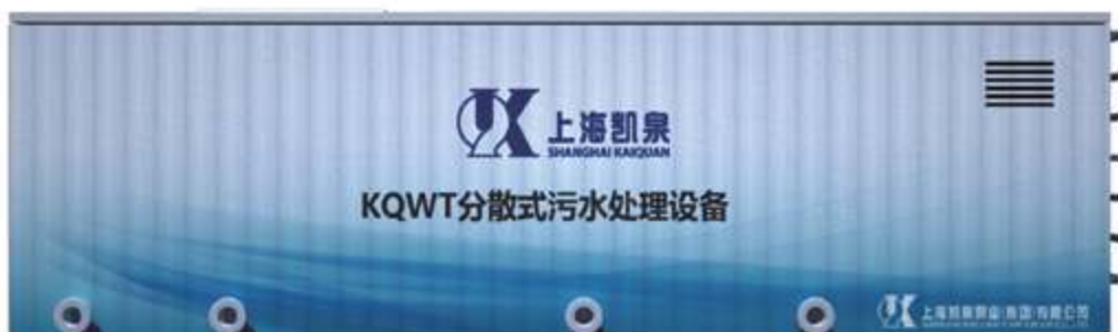
KQWT Децентрализованное оборудование для очистки сточных вод