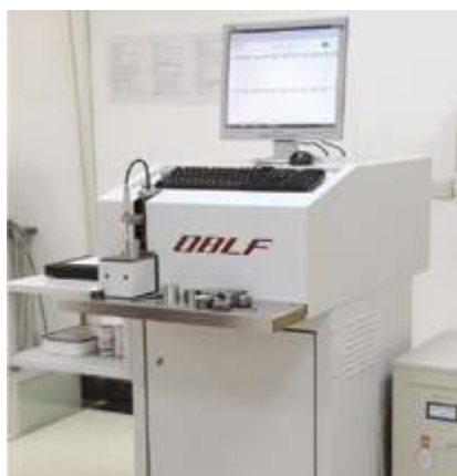
Спектрометр прямого считывания