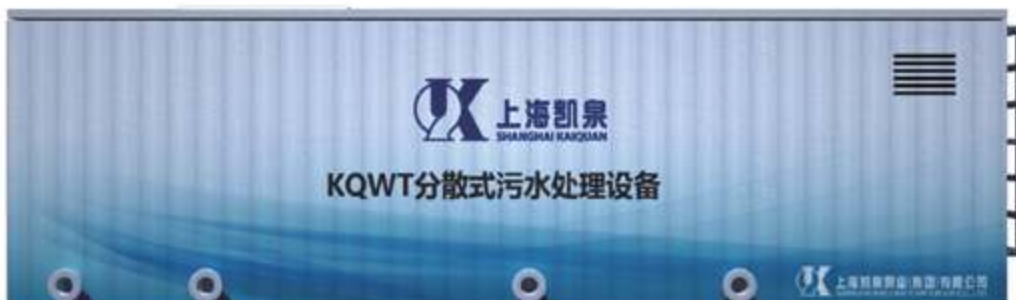
KQWT Децентрализованное оборудование для очистки сточных вод