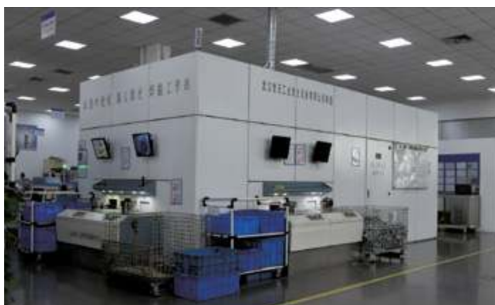
Роботизированная рабочая станция для лазерной сварки