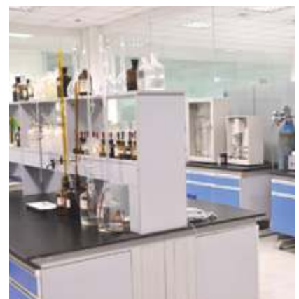
Лаборатория химического анализа