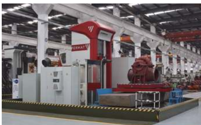
Обрабатывающий центр Феймат (Feimat)