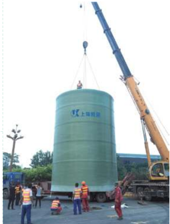
Комплектная насосная станция