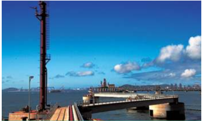
Ханайленд Оил Депо