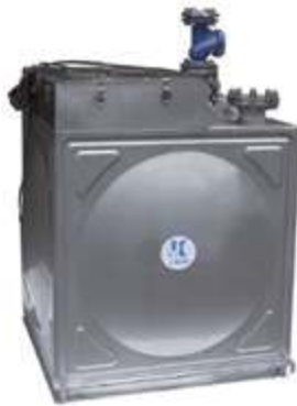
Подъёмное устройство для сточных вод