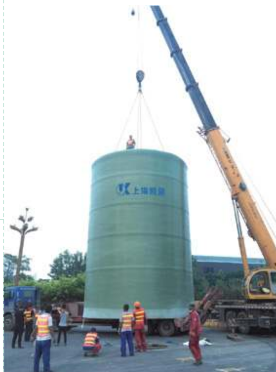
Комплектная насосная станция