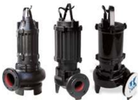
Погружные насосы небольшой производительности