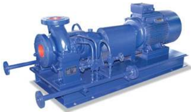
KQWR-G Насос для перегретой воды