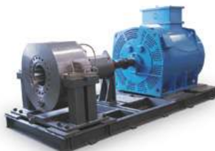
Насос для сброса тепла вторичного контура