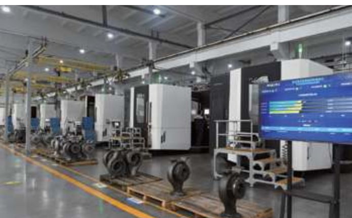
Обрабатывающий центр Деаг (Deag)