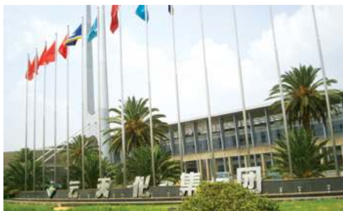
Лимитед Юньнань Юньтяньхуа