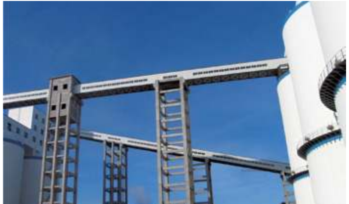
Вихревая углеобогащательная установка Хуайбэй Майнинг Групп