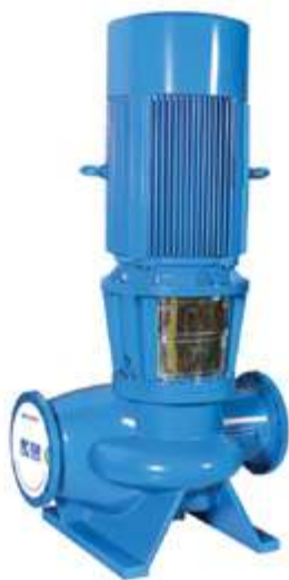
SGG Насос двустороннего входа

Опираясь на передовые технологии, надёжность, быстрое и качественное обслуживание, компания «SHANGHAI KAIQUAN PUMP (GROUP)» завоевала доверие огромного количества клиентов. Широкая линейка насосного оборудования используется в системах водоснабжения, противопожарной защиты, дренажа, отопления и кондиционирования воздуха в гостиницах, коммерческих зданиях, метро, аэропортах и на прочих объектах. Насосы имеют высокую энергоэффективность и производительность, отличаются стабильной и надёжной работой.