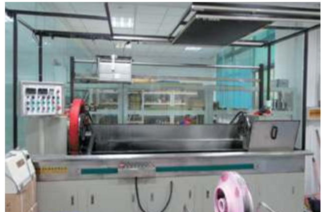
Полуавтоматический флуоресцентный дефектоскоп