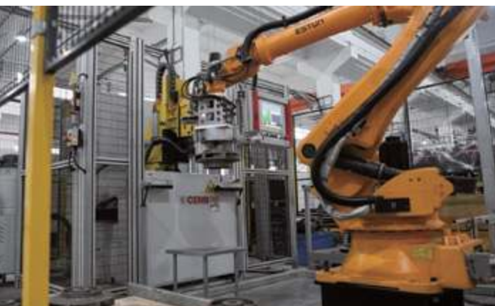
Оборудование для автоматической балансировки рабочего колеса CEBR