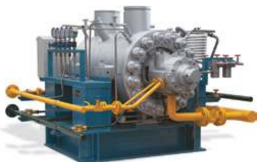
Питательные насосы высокого давления