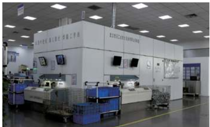
Роботизированная рабочая станция для лазерной сварки