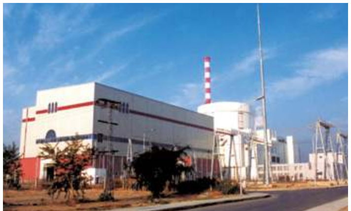
Блоки АЭС С3, С4 Пакистан Часима