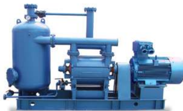
2BEK Водокольцевой вакуумный насос