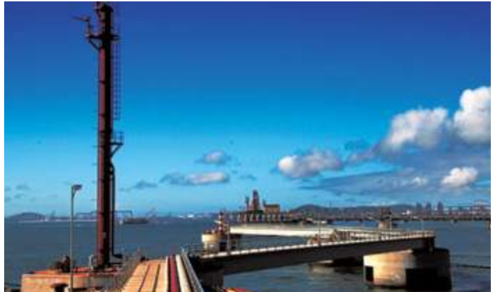
Ханайленд Оил Депо