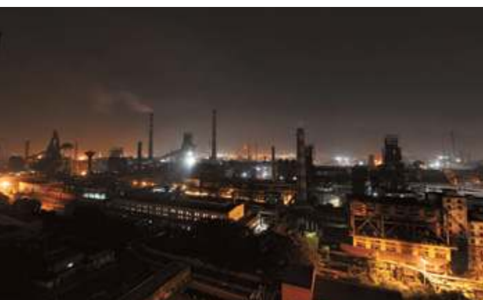
Металургическая компания г. Ухань