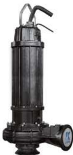
Погружной насос для сточных вод серии WQ

В 2008 году концерн «SHANGHAI KAIQUAN PUMP (GROUP)» инвестировал 1 млрд юаней в создание компании Hefei Kaiquan Electric Pump Co., Ltd. Новый завод производит оборудование, отвечающее требованиям различных станций очистки сточных вод и подъёмных насосных станций с суточной производительностью не менее 400 000 тонн. Поставляются насосы для очистки сточных вод, погружные осевые насосы со смешанным потоком и смесители для очистных сооружений. Оборудование характеризуется повышенной производительностью и надёжностью.