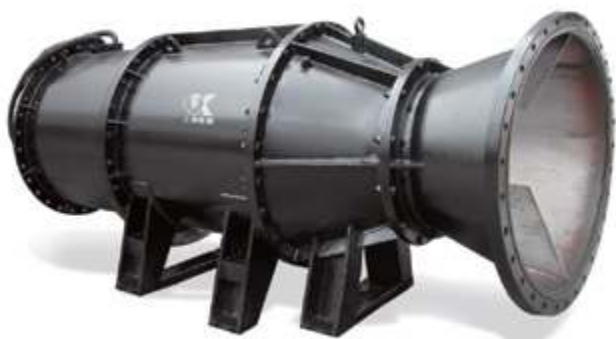
Погружной трубчатый насос

Осевые и диагональные насосы высокой и сверхвысокой производительности также широко применяются в ключевых национальных водоохранных проектах, таких как проекты Южно-Северного и Желтого водоотводов.