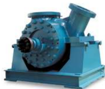
Основной питательный насос