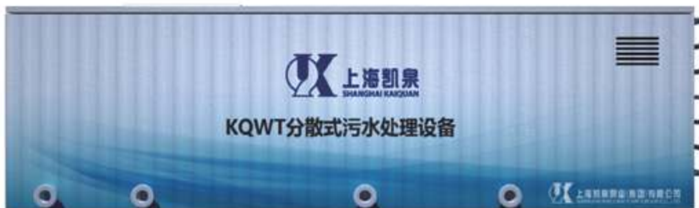
KQWT Децентрализованное оборудование для очистки сточных вод