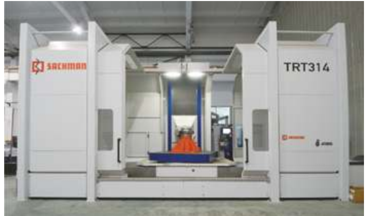
Пятиосевой высокоскоростной фрезерный станок