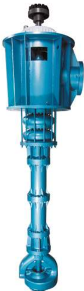
Насос для водооборотных циклов

Компания «SHANGHAI KAIQUAN PUMP (GROUP)» разработала, изготовила и провела ряд испытаний питательных насосов для котлов, насосов рециркуляции воды, конденсатных и вакуумных насосов для угольной энергетики и энергетики на биомассе. Имеются многочисленные примеры успешных проектов.