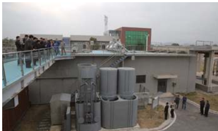
Группа угольной промышленности Шэньхуа Нинся