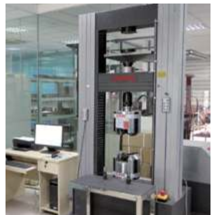
Микрокомпьютерная универсальная испытательная машина