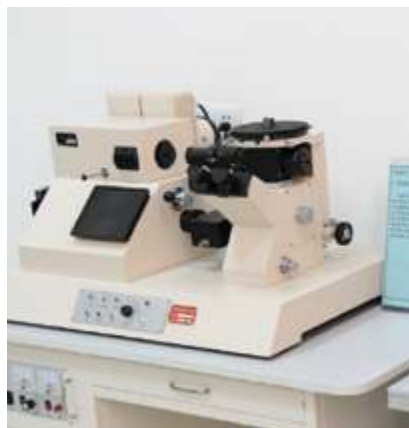
Большой металлографический микроскоп