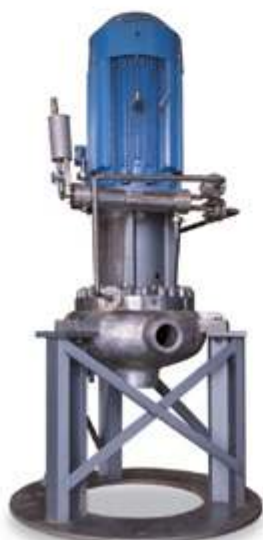
AP1000 Насос для сброса тепла третичного контура