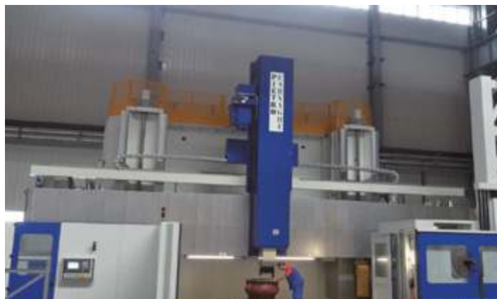
Сверхмощный высокоточный вертикальный фрезерный центр