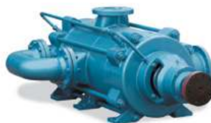
ZPMD Многоступенчатый насос высокого давления