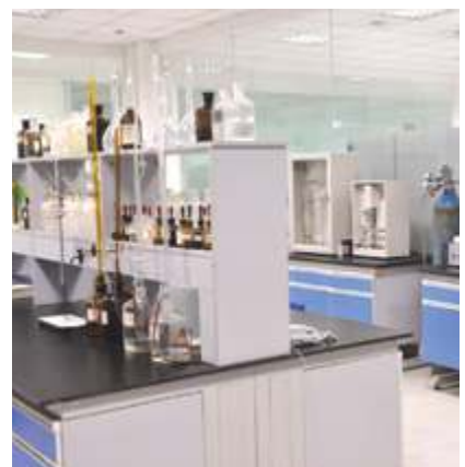
Лаборатория химического анализа