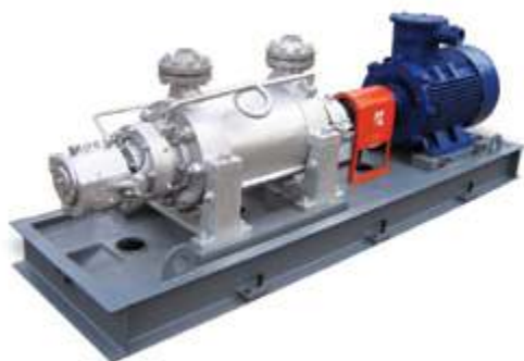
AY Многоступенчатый насос

В настоящее время концерн Kaiquan производит 9 серий и 250 разновидностей насосов, которые могут использоваться в нефтехимической промышленности. Продукция соответствует национальному стандарту GB, стандарту Американского института нефти API 610, американскому стандарту ANSI, международному стандарту ISO и др. Насос может выдерживать температуру среды от – 45 до + 450 °С, а самое высокое рабочее давление может достигать 9 МПа.