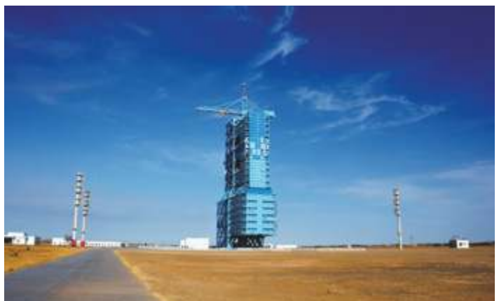
Место запуска спутника Сицюань