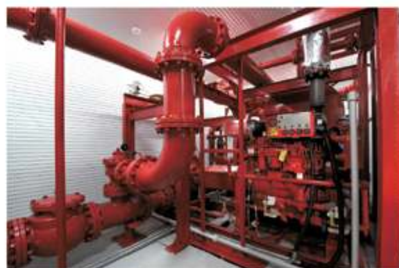
Пожарная насосная станция