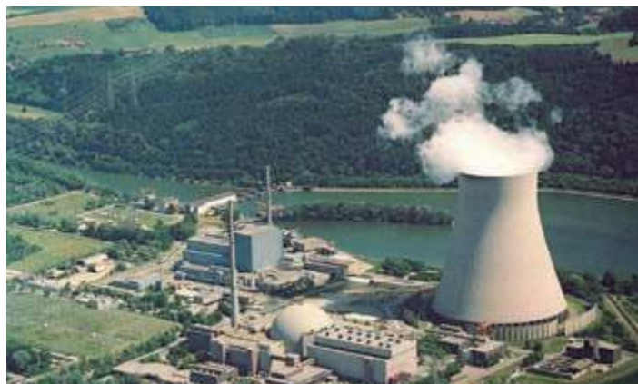
Атомная электростанция Хинкли-Пойнт