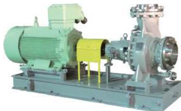
KCZ Насос для химических процессов

Мембранный насос высокого давления для опреснения морской воды и бустерный насос высокого давления с суточной производительностью 5 000 – 12 500 тонн стабильны и надежны в работе. Получен заказ на 10 000 насосов высокого давления для опреснения морской воды на электростанции Датан Хуандао.