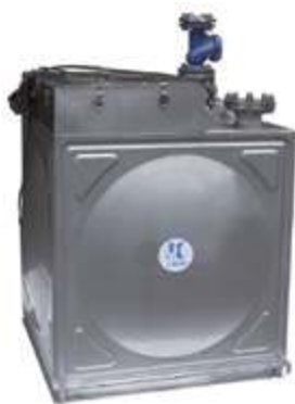
Подъёмное устройство для сточных вод