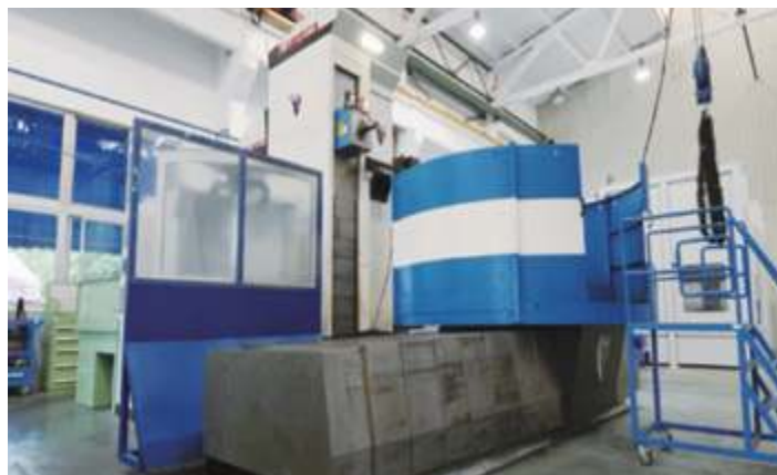
Четырехосевой горизонтально-фрезерный станок