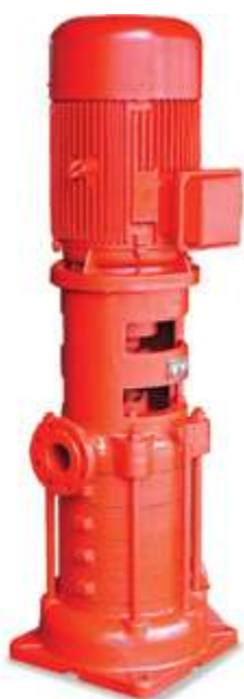
XBD Вертикальный пожарный насос