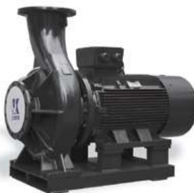
KQW Одноступенчатый насос