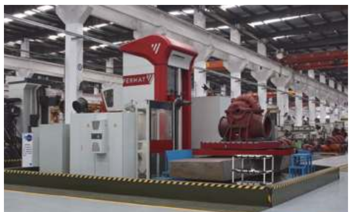
Обрабатывающий центр Феймат (Feimat)