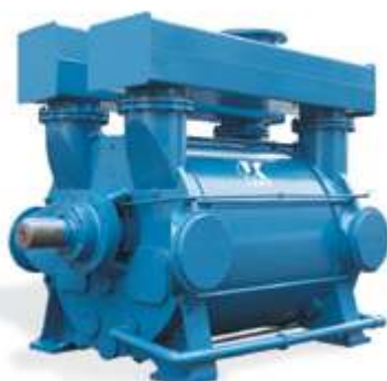
2BEK Водокольцевой вакуумный насос