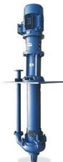
KZJL Вертикальные шламовые насосы