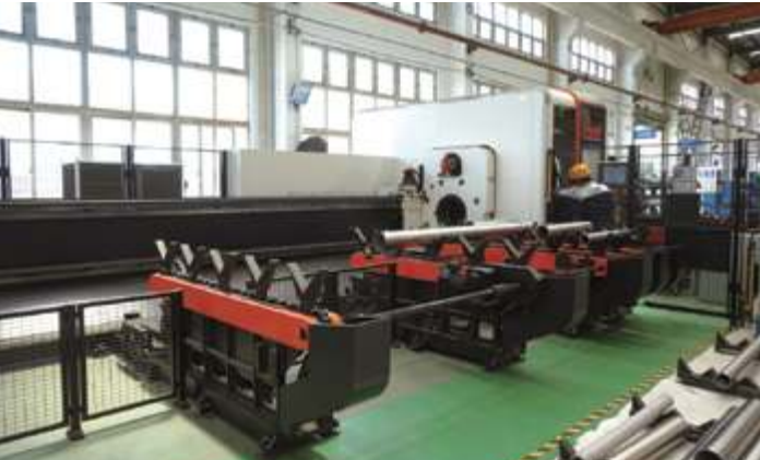
Станок для лазерной 3D-резки