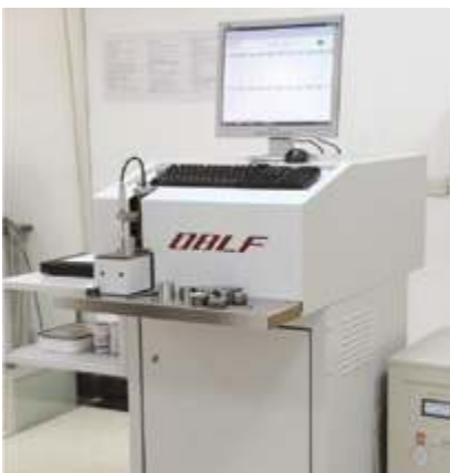
Спектрометр прямого считывания