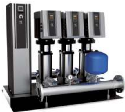
KQGV Установка повышения давления