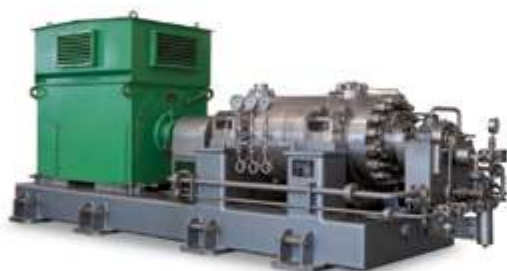
Насос второго контура высокого давления