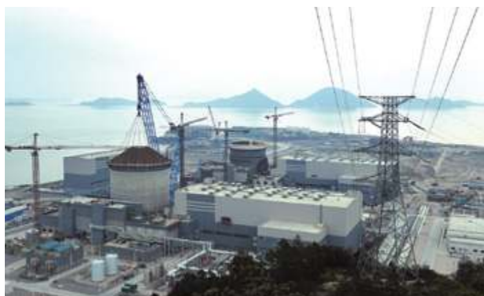
Атомная электростанция Санмэнь