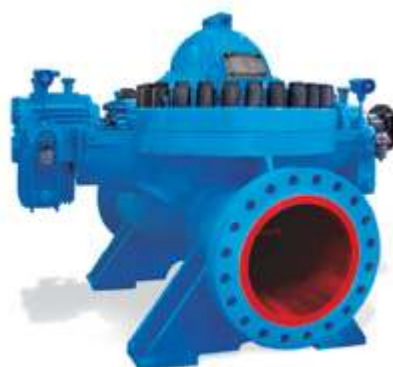
KSY Магистральный нефтяной насос