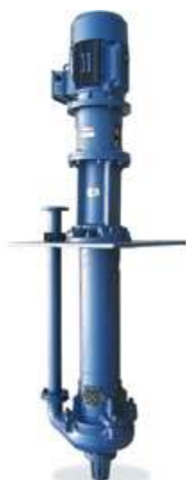
KZJL Вертикальные шламовые насосы