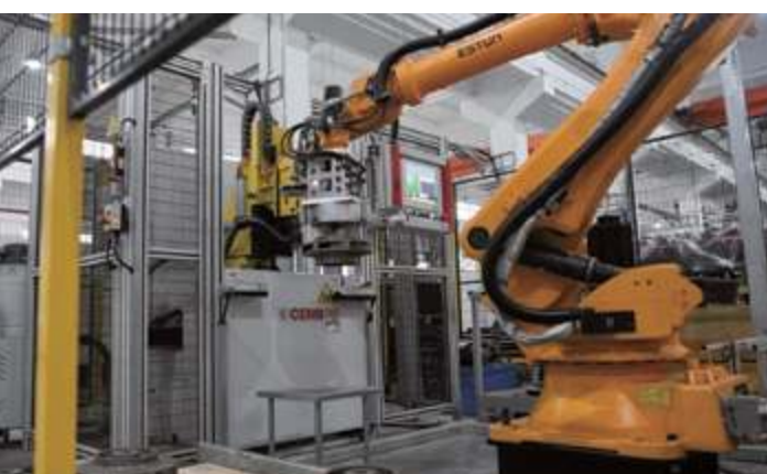
Оборудование для автоматической балансировки рабочего колеса CEBR