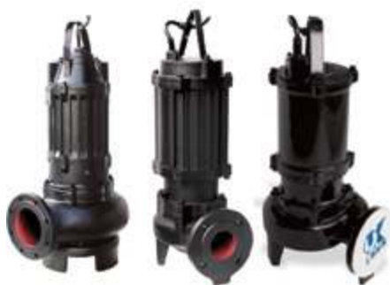
Погружные насосы небольшой производительности