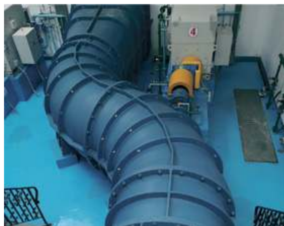
Насос с удлинителем вала типа S