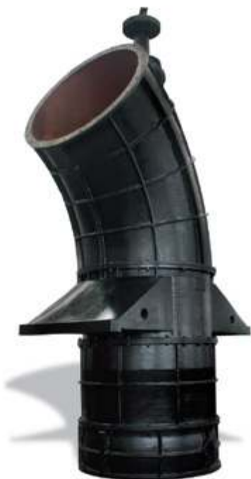
ZLHL Осевой насос