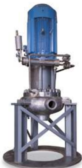
AP1000 Насос для сброса тепла третичного контура