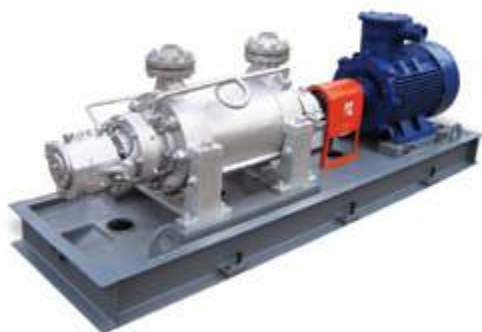
AY Многоступенчатый насос

В настоящее время концерн Kaiquan производит 9 серий и 250 разновидностей насосов, которые могут использоваться в нефтехимической промышленности. Продукция соответствует национальному стандарту GB, стандарту Американского института нефти API 610, американскому стандарту ANSI, международному стандарту ISO и др. Насос может выдерживать температуру среды от – 45 до + 450 °С, а самое высокое рабочее давление может достигать 9 МПа.