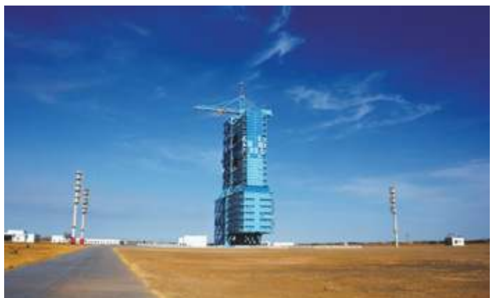
Место запуска спутника Сицюань