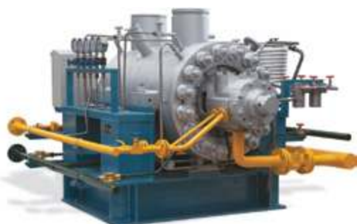
Питательные насосы высокого давления