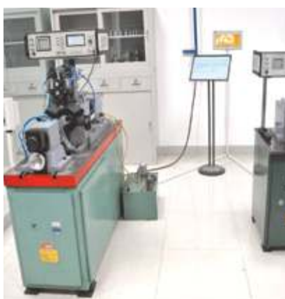
Большой металлографический микроскоп