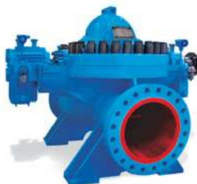
KSY Магистральный нефтяной насос