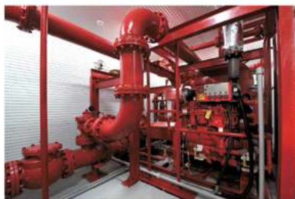
Пожарная насосная станция