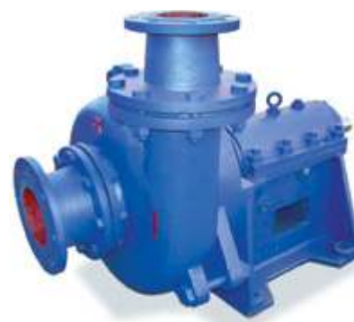
KD Однокорпусной лопастной насос для шлама