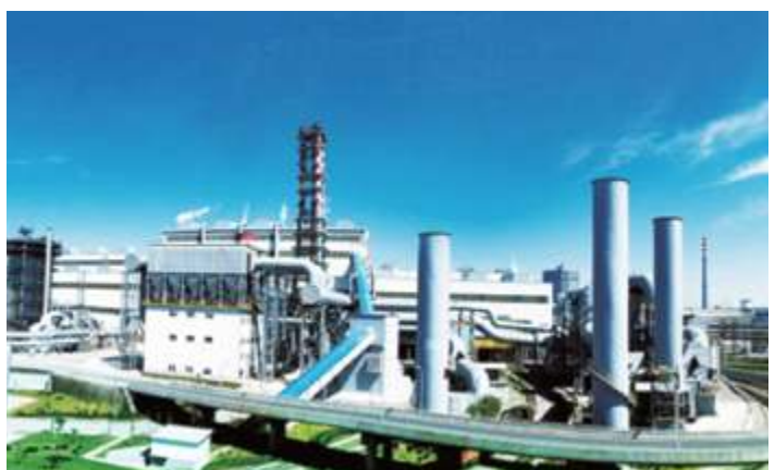
Хэбэйское железо и сталь