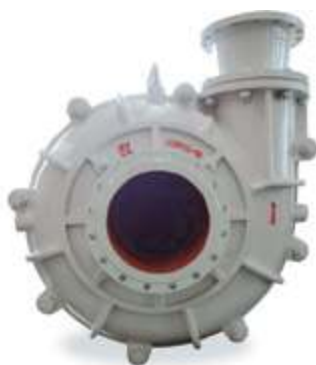
KXZ Шламовый насос

Чтобы создать профессиональный завод по производству насосов для откачки примесей с оборудованием для литья, термообработки и механической обработки, компания «SHANGHAI KAIQUAN PUMP (GROUP)» инвестировала в 2005 году 120 млн юаней. Производимая продукция охватывает 5 серий и 160 спецификаций для применения на различных объектах горнодобывающей промышленности, металлургии, сероочистки электростанций, дноуглубительных работ на реках, глинозема, химической, угольной промышленности и других.