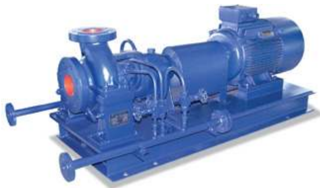
KQWR-G Насос для перегретой воды