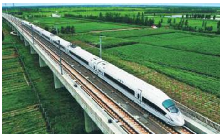
Оборудование для водоснабжения, пожаротушения, кондиционирования воздуха на станциях высокоскоростной железной дороги