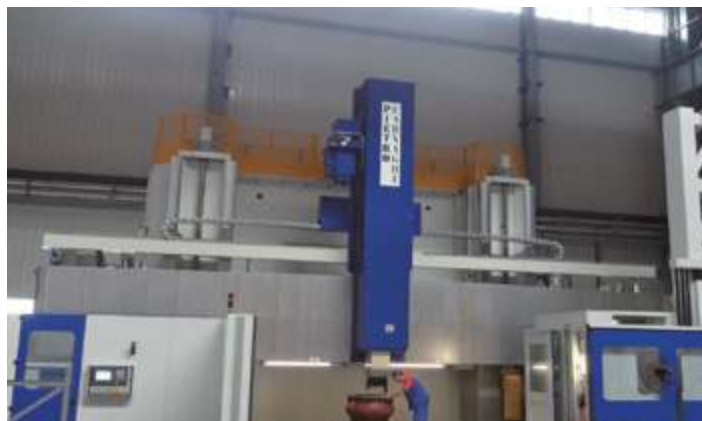
Сверхмощный высокоточный вертикальный фрезерный центр