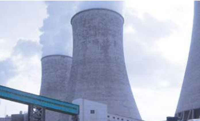
Национальная электро-энергетическая компания