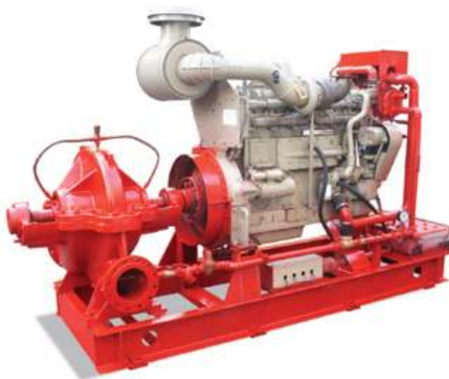
Дизельная пожарная станция