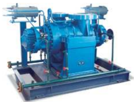
HKY Насос для тяжелых условий эксплуатации