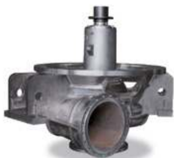
Насос второго контура

Компания «SHANGHAI KAIQUAN PUMP (GROUP)» накопила большой опыт в области исследований и разработок, производства, испытаний и использования основных продуктов для атомной энергетики благодаря разработке прототипов оборудования второго и третьего поколения.