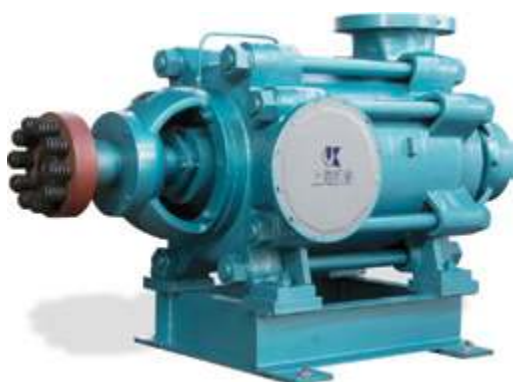
Шахтный многоступенчатый насос типа D

Многоступенчатый шахтный насос типа D, насос двойного всасывания KQSN, шламовый насос KZJ, вакуумный насос и насос с длинным валом типа LC имеют высокую производительность, качество и надёжность конструкции. Мы предоставляем продукцию и услуги для сталелитейной и металлургической промышленности.