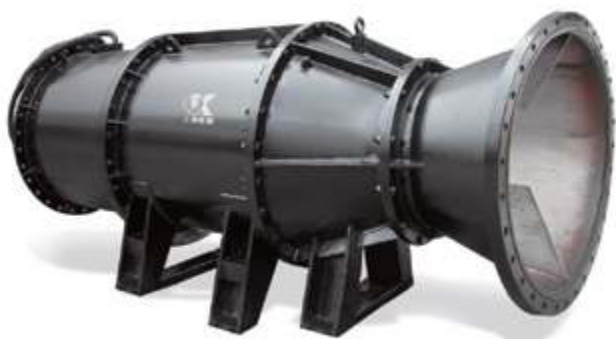
Погружной трубчатый насос

Осевые и диагональные насосы высокой и сверхвысокой производительности также широко применяются в ключевых национальных водоохранных проектах, таких как проекты Южно-Северного и Желтого водоотводов.