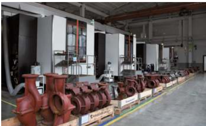
Вертикальный обрабатывающий центр MAZAK