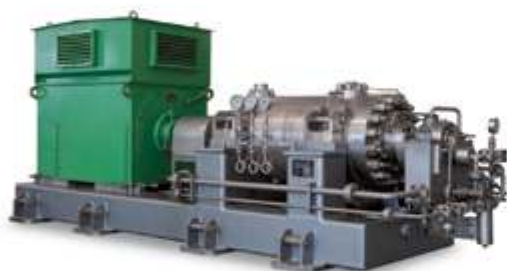
Насос второго контура высокого давления