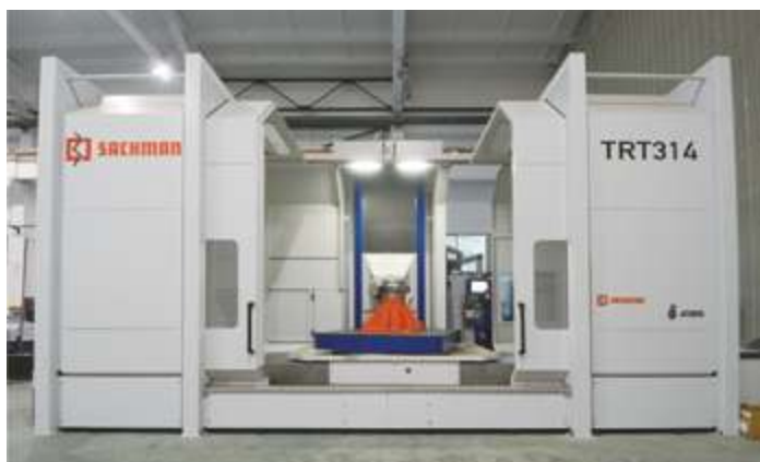
Пятиосевой высокоскоростной фрезерный станок