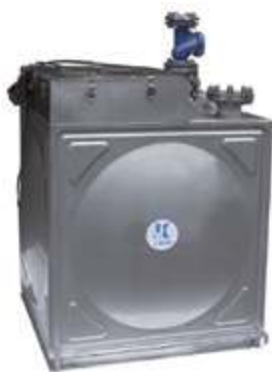
Подъёмное устройство для сточных вод