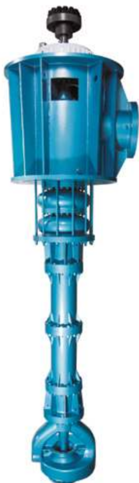
Насос для водооборотных циклов

Компания «SHANGHAI KAIQUAN PUMP (GROUP)» разработала, изготовила и провела ряд испытаний питательных насосов для котлов, насосов рециркуляции воды, конденсатных и вакуумных насосов для угольной энергетики и энергетики на биомассе. Имеются многочисленные примеры успешных проектов.