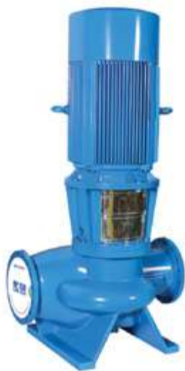
SGG Насос двустороннего входа

Опираясь на передовые технологии, надёжность, быстрое и качественное обслуживание, компания «SHANGHAI KAIQUAN PUMP (GROUP)» завоевала доверие огромного количества клиентов. Широкая линейка насосного оборудования используется в системах водоснабжения, противопожарной защиты, дренажа, отопления и кондиционирования воздуха в гостиницах, коммерческих зданиях, метро, аэропортах и на прочих объектах. Насосы имеют высокую энергоэффективность и производительность, отличаются стабильной и надёжной работой.