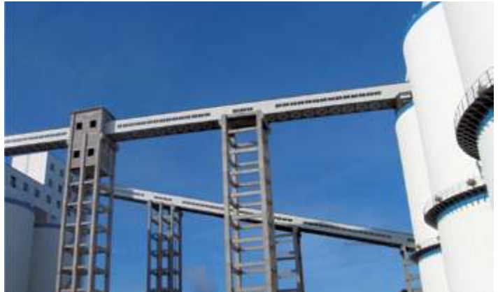
Вихревая углеобогащательная установка Хуайбэй Майнинг Групп