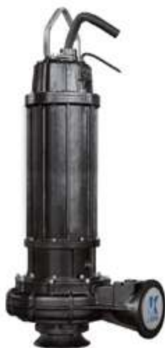
Погружной насос для сточных вод серии WQ

В 2008 году концерн «SHANGHAI KAIQUAN PUMP (GROUP)» инвестировал 1 млрд юаней в создание компании Hefei Kaiquan Electric Pump Co., Ltd. Новый завод производит оборудование, отвечающее требованиям различных станций очистки сточных вод и подъёмных насосных станций с суточной производительностью не менее 400 000 тонн. Поставляются насосы для очистки сточных вод, погружные осевые насосы со смешанным потоком и смесители для очистных сооружений. Оборудование характеризуется повышенной производительностью и надёжностью.