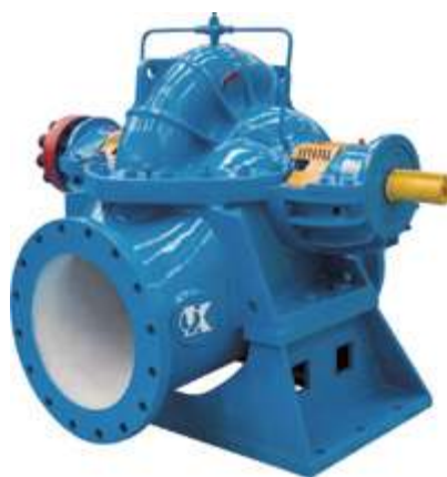
Насос двустороннего входа KQSS/KQSN