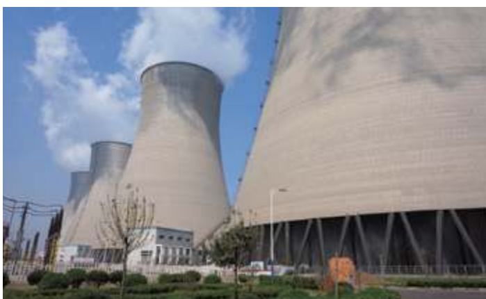
Шаньдунская электростанция Цзоупин