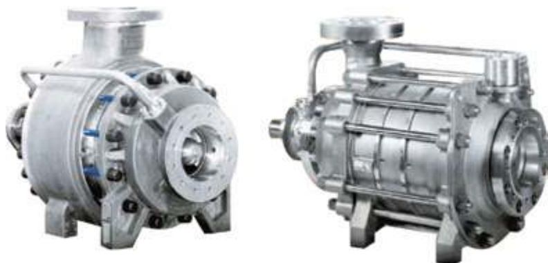
HQHG Насосы высокого давления для опреснения морской воды

Химические насосы, насосы для перегретой воды, вакуумные ртутные и канализационные насосы концерна Kaiquan широко используются в бумажной, табачной, сахарной, пищевой, фармацевтической, химической и других областях промышленности.