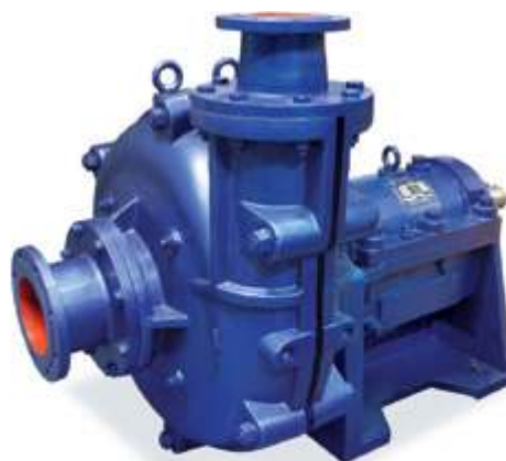
KZJ Шламовые насосы