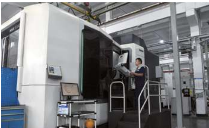
Обрабатывающий центр DMG NHX8000