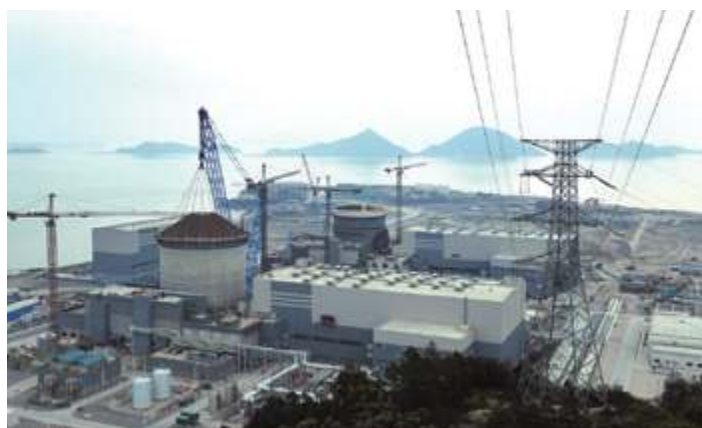
Атомная электростанция Санмэнь