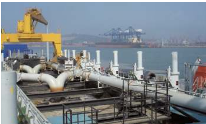
Аньшань айрон энд стил Ко.