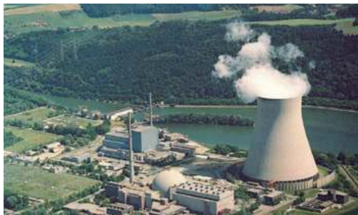
Атомная электростанция Хинкли-Пойнт