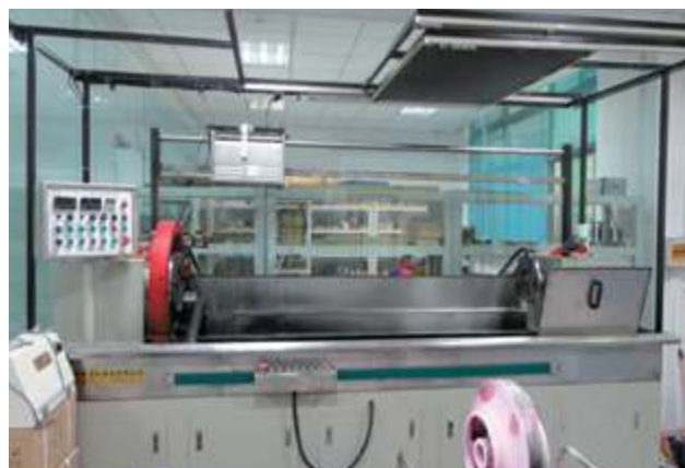
Полуавтоматический флуоресцентный дефектоскоп