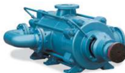
ZPMD Многоступенчатый насос высокого давления