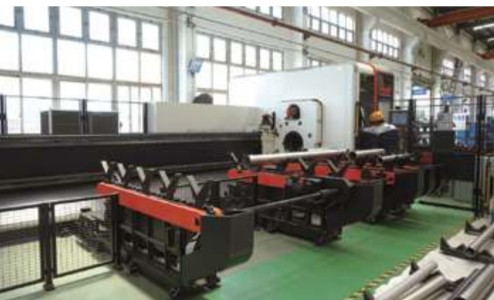
Станок для лазерной 3D-резки