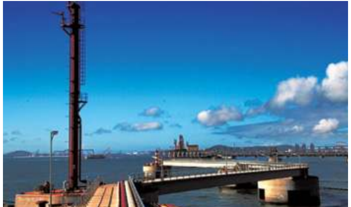
Ханайленд Оил Депо