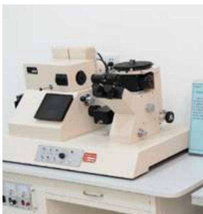
Большой металлографический микроскоп