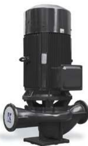
KQL Вертикальный одноступенчатый насос