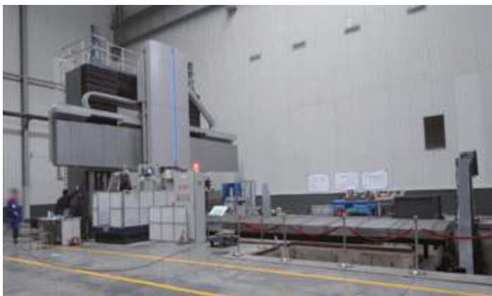
Шестиосевой, пятиосевой порталный фрезерный и расточный обрабатывающий центр