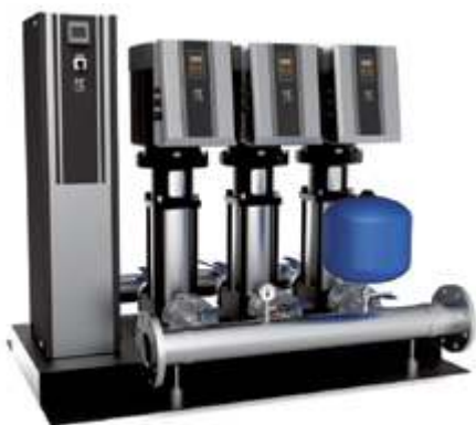
KQGV Установка повышения давления