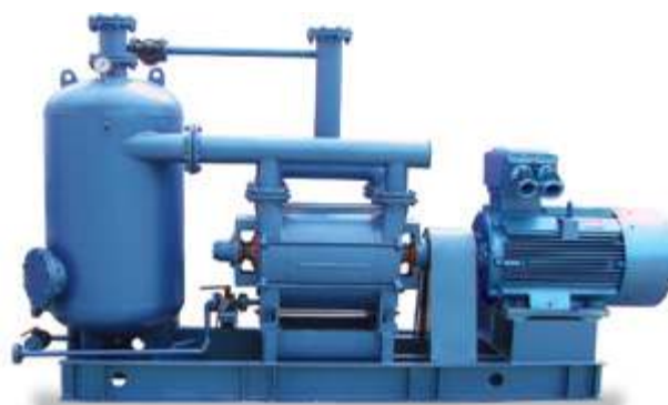
2BEK Водокольцевой вакуумный насос