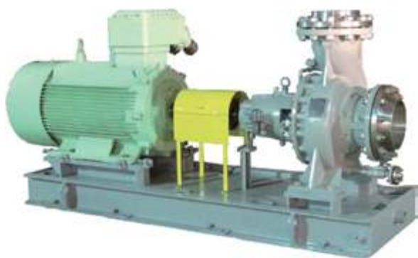
KCZ Насос для химических процессов