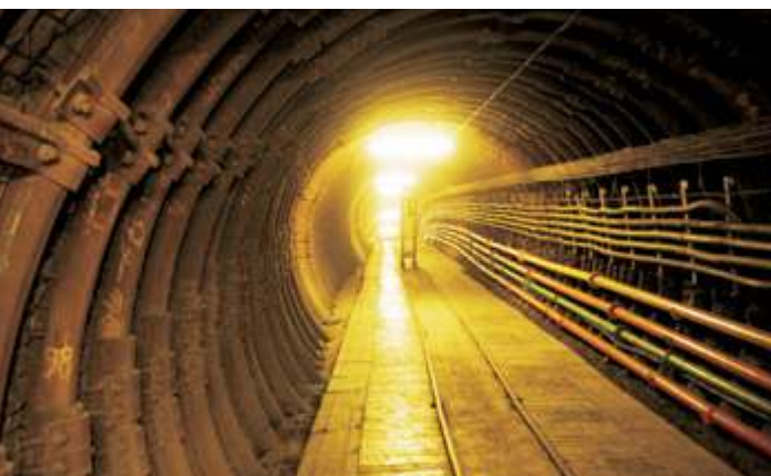
Групп Лимитед Шаньси Лексус Энерджи Инвестмент