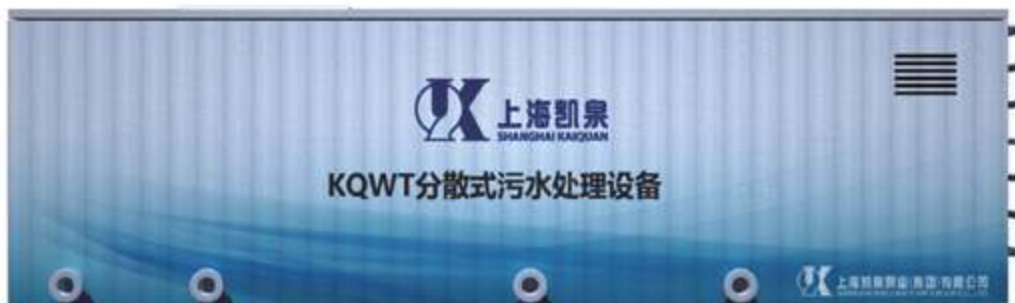
KQWT Децентрализованное оборудование для очистки сточных вод