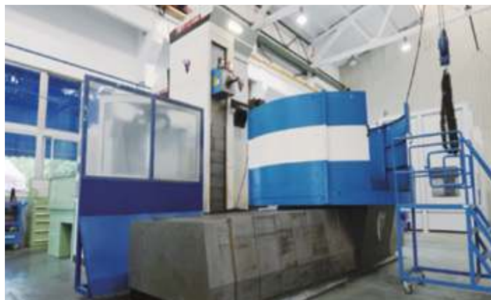
Четырехосевой горизонтально-фрезерный станок