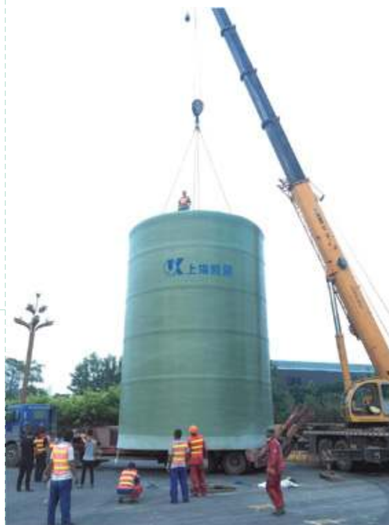
Комплектная насосная станция