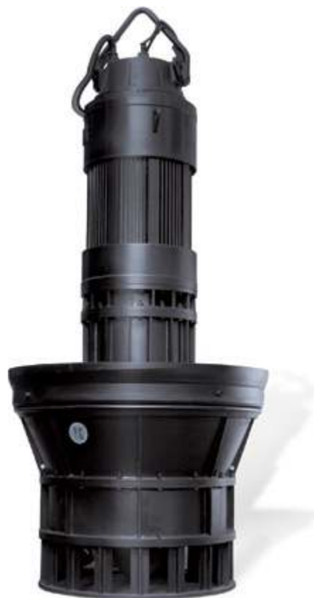
ZQ Погружной осевой насос