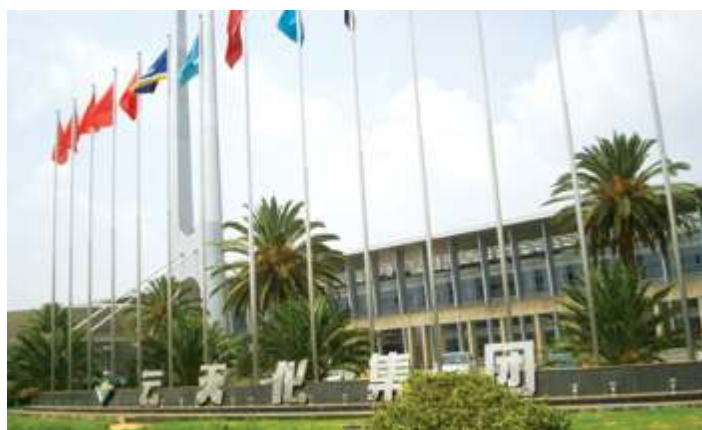
Лимитед Юньнань Юньтяньхуа