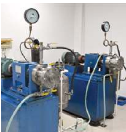
Платформа для испытаний механических уплотнений