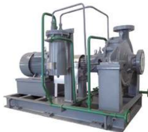
KZE Насос для технологических процессов