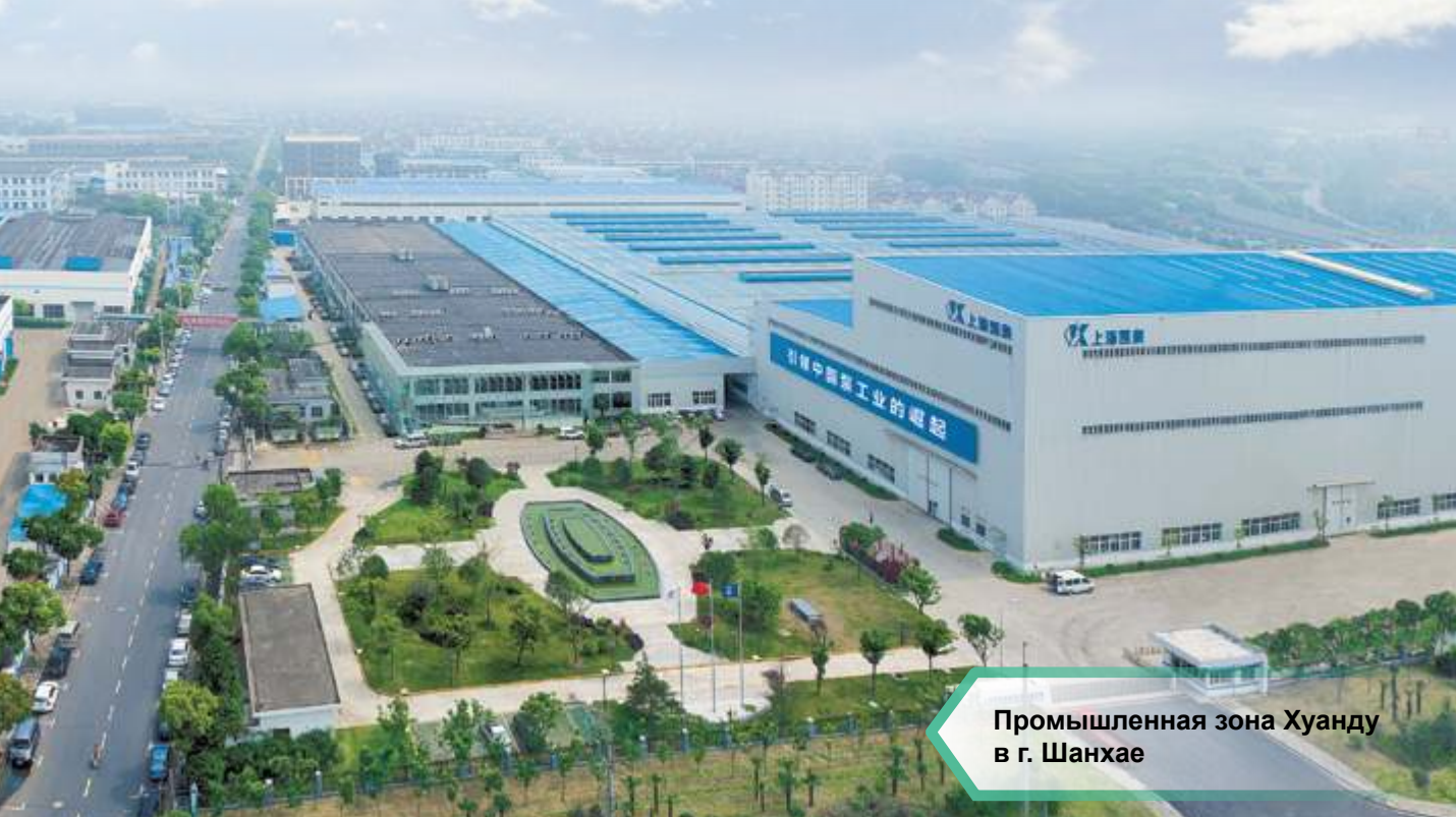
Промышленная зона Хунду в г. Шанхае

В планах компании: развитие дилерской и сервисной сети в Москве и регионах, предоставление коммерческих предложений, оптимальных по стоимости и оперативных по срокам доставки, проведение крупных маркетинговых и PR активностей.