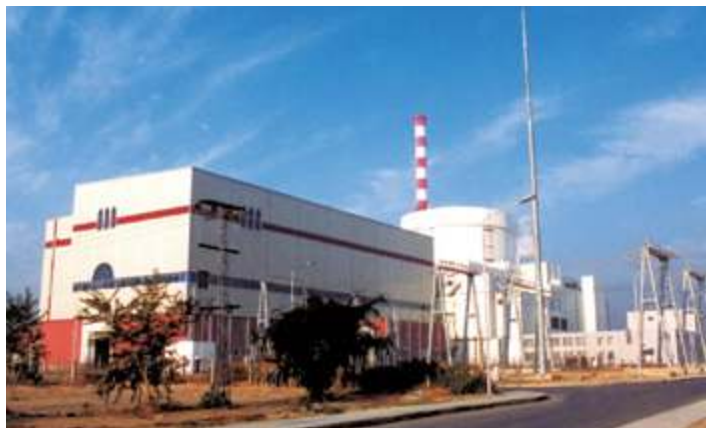
Блоки АЭС С3, С4 Пакистан Часима