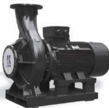
KQW Одноступенчатый насос