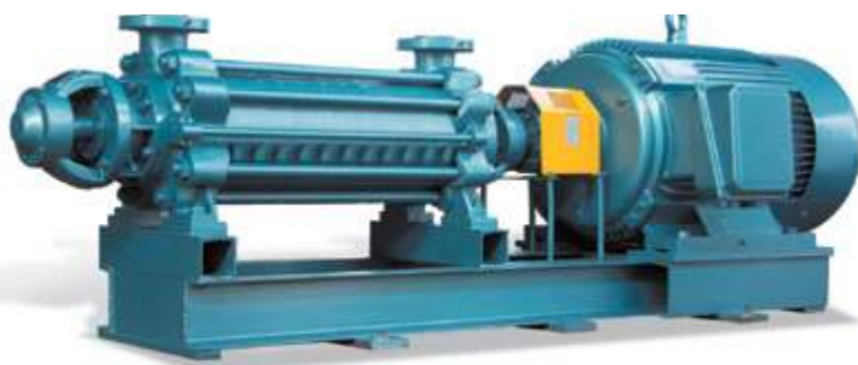
DG Питательные насосы