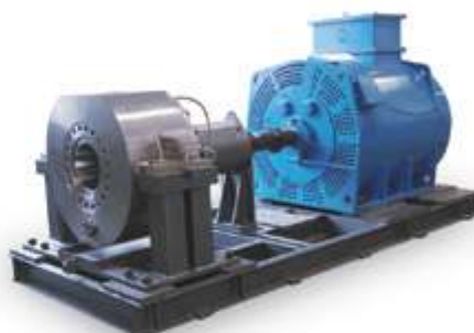
Насос для сброса тепла вторичного контура