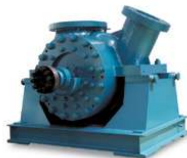
Основной питательный насос