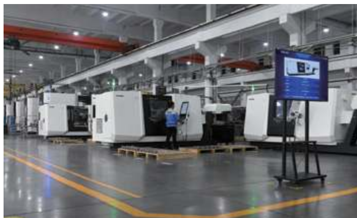
Центр обработки рабочего колеса DMG CLX550