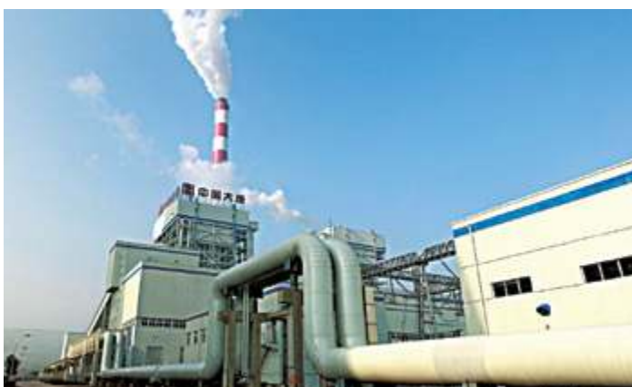
Тепловая электростанция Датанг Баоцзи