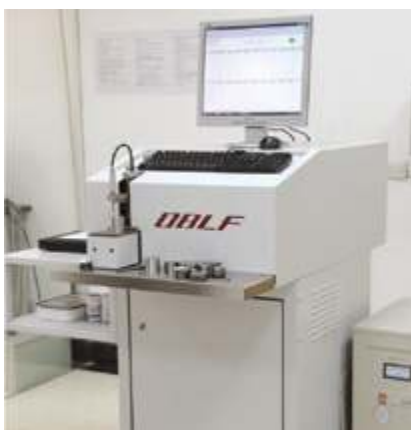
Спектрометр прямого считывания