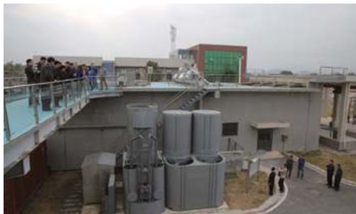
Группа угольной промышленности Шэньхуа Нинся