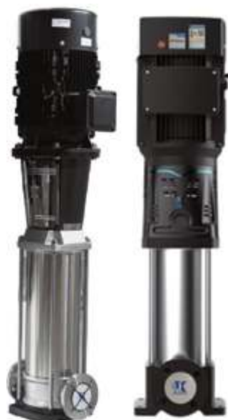
KQDQ/KQDP Многоступенчатый центробежный насос