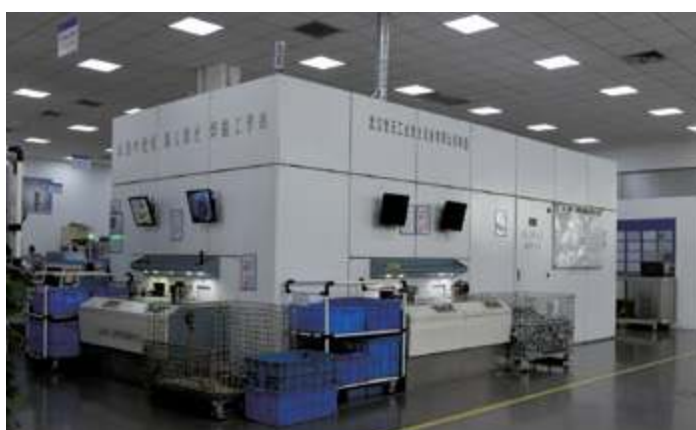
Роботизированная рабочая станция для лазерной сварки