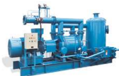
2BWD Комплекты водокольцевых вакуумных насосов