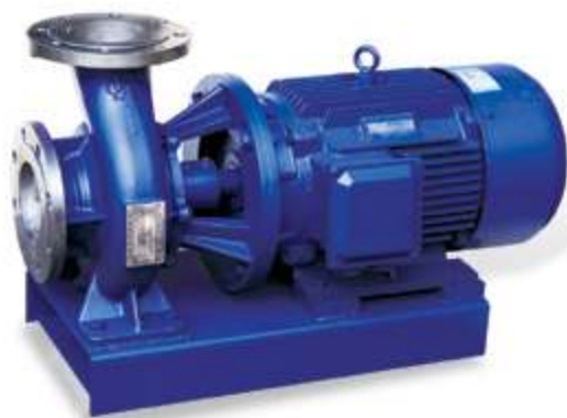
KQWH Химический насос