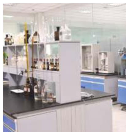
Лаборатория химического анализа