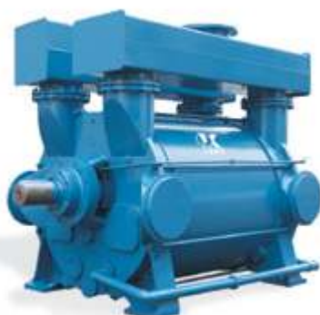
2BEK Водокольцевой вакуумный насос