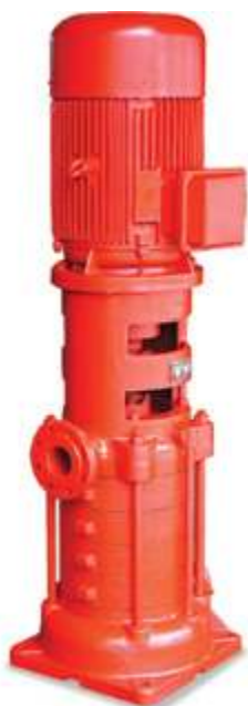
XBD Вертикальный пожарный насос