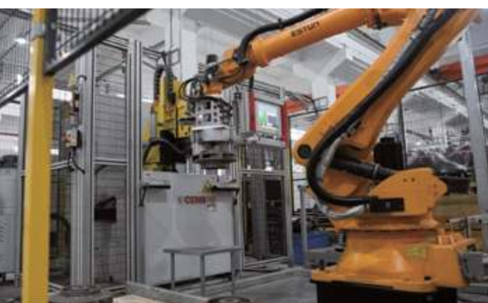
Оборудование для автоматической балансировки рабочего колеса CEBR