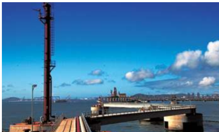
Ханайленд Оил Депо