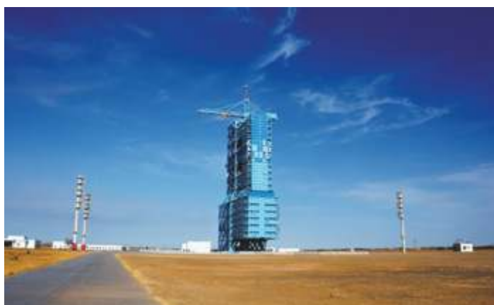
Место запуска спутника Сицюань