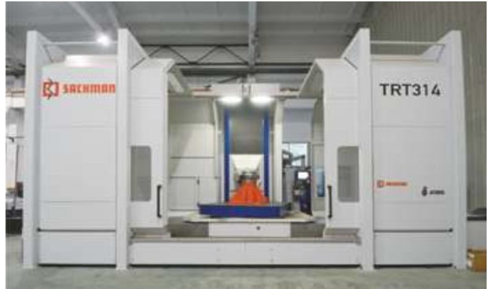
Пятиосевой высокоскоростной фрезерный станок